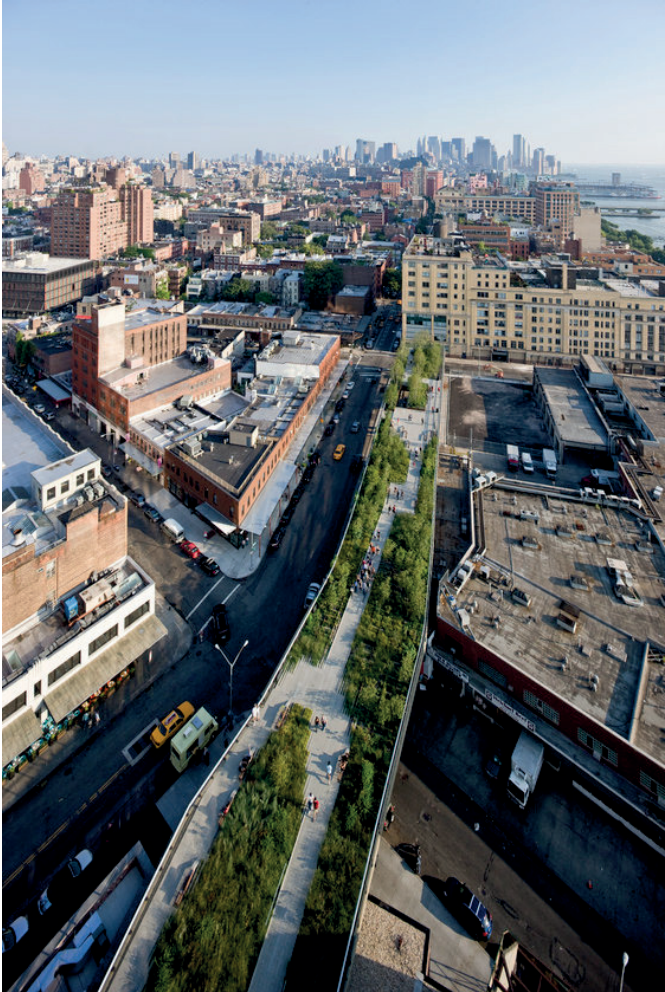
Fiedls Operations et SCOFIDIO + RENFO (cabinets d'architecture), High Line , 2009, New-York.