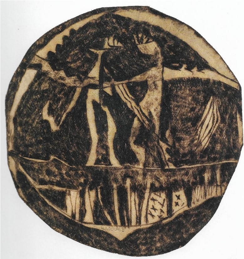
Louis LAUCHEZ, Lanmou gwo monn , 2007, Ecorce gravée, 54 x 52 cm