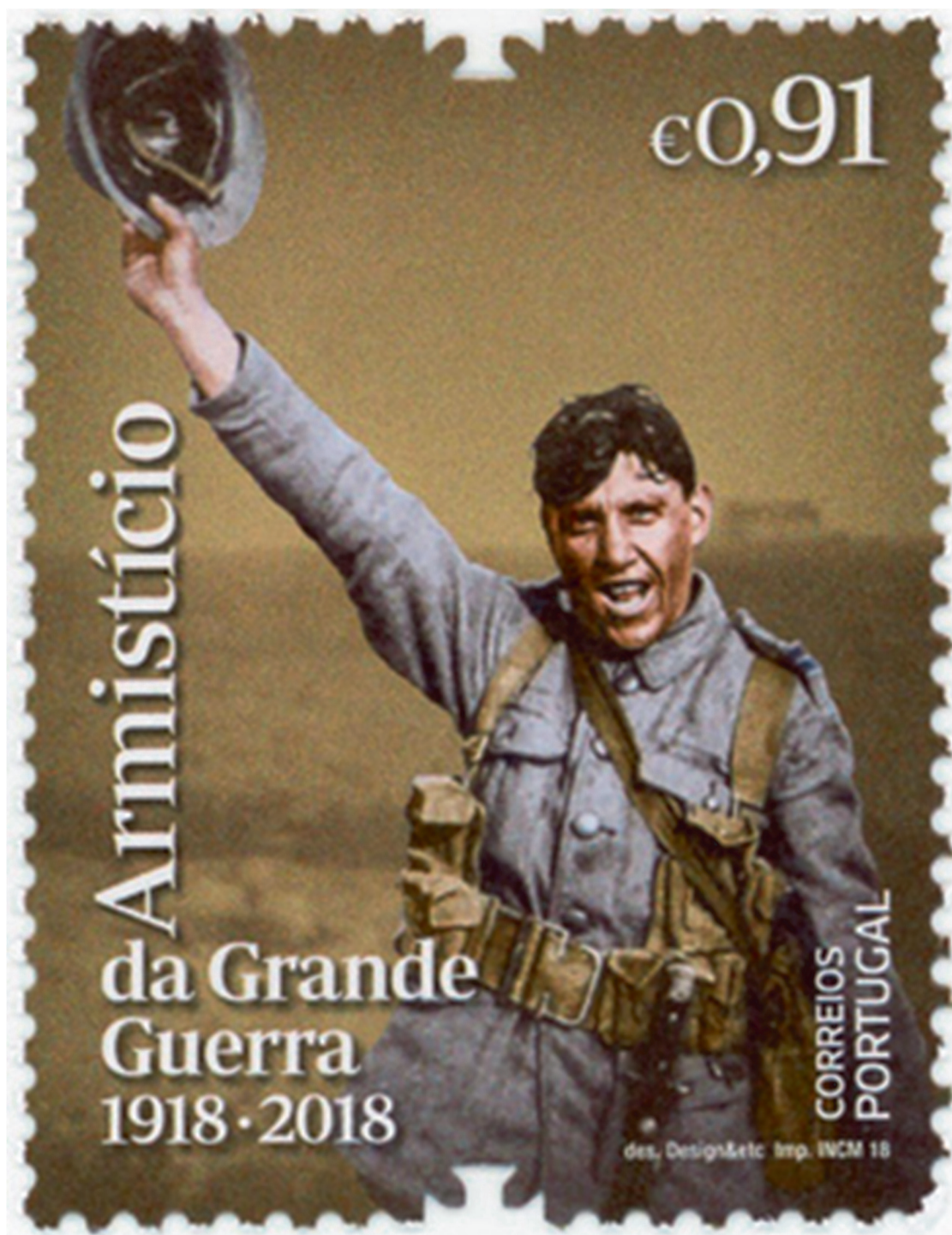
Selo emitido pelos CTT-Correios de Portugal para comemorar o Centenário do Armistício da Grande Guerra.