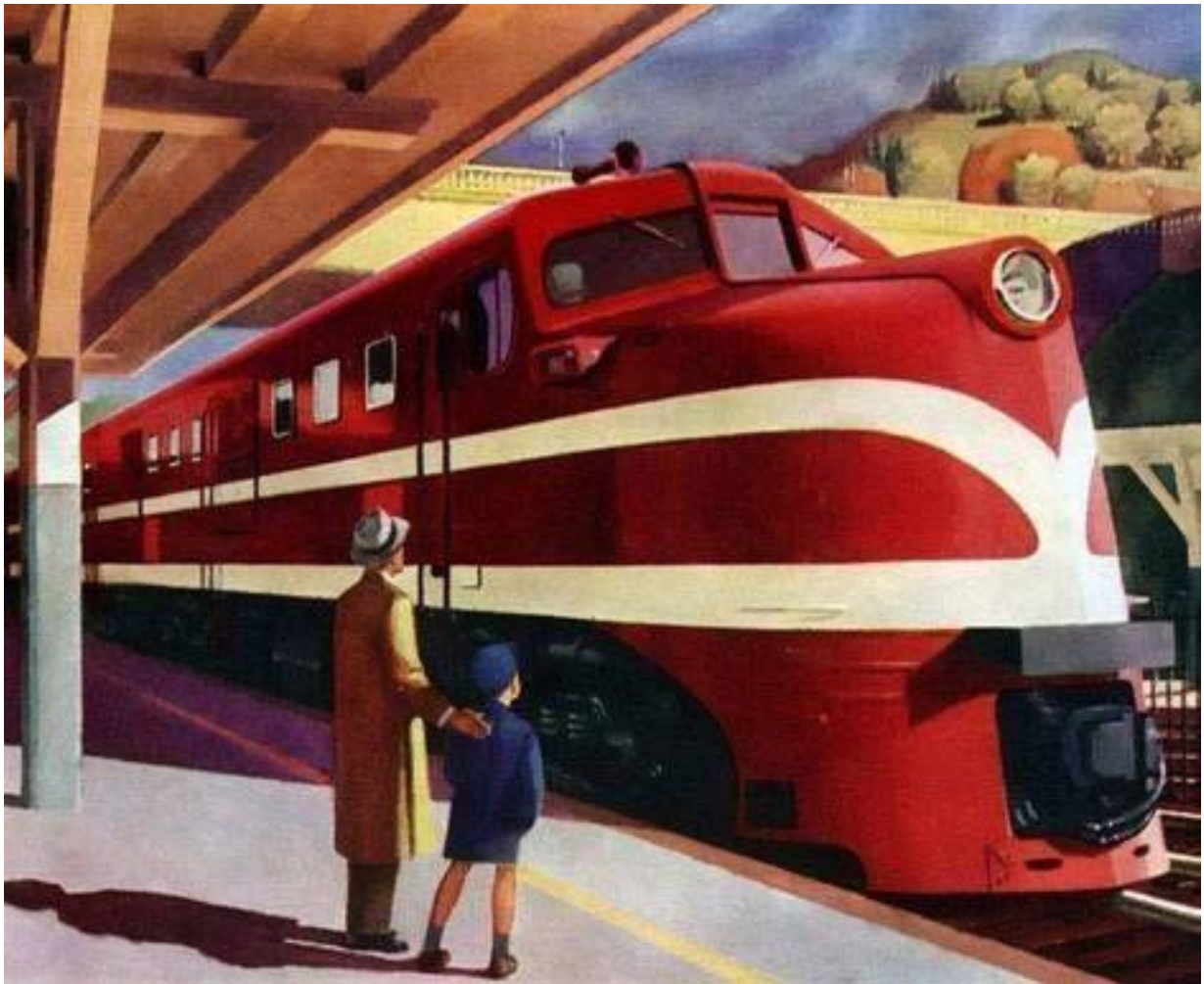
Edward Hopper, Locomotive , 1944, Withney Museum of American art, New York