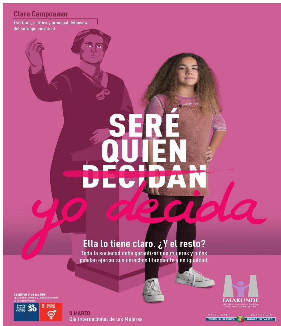
Cartel para el Día Internacional de la mujer, Universidad del País Vasco, 2019