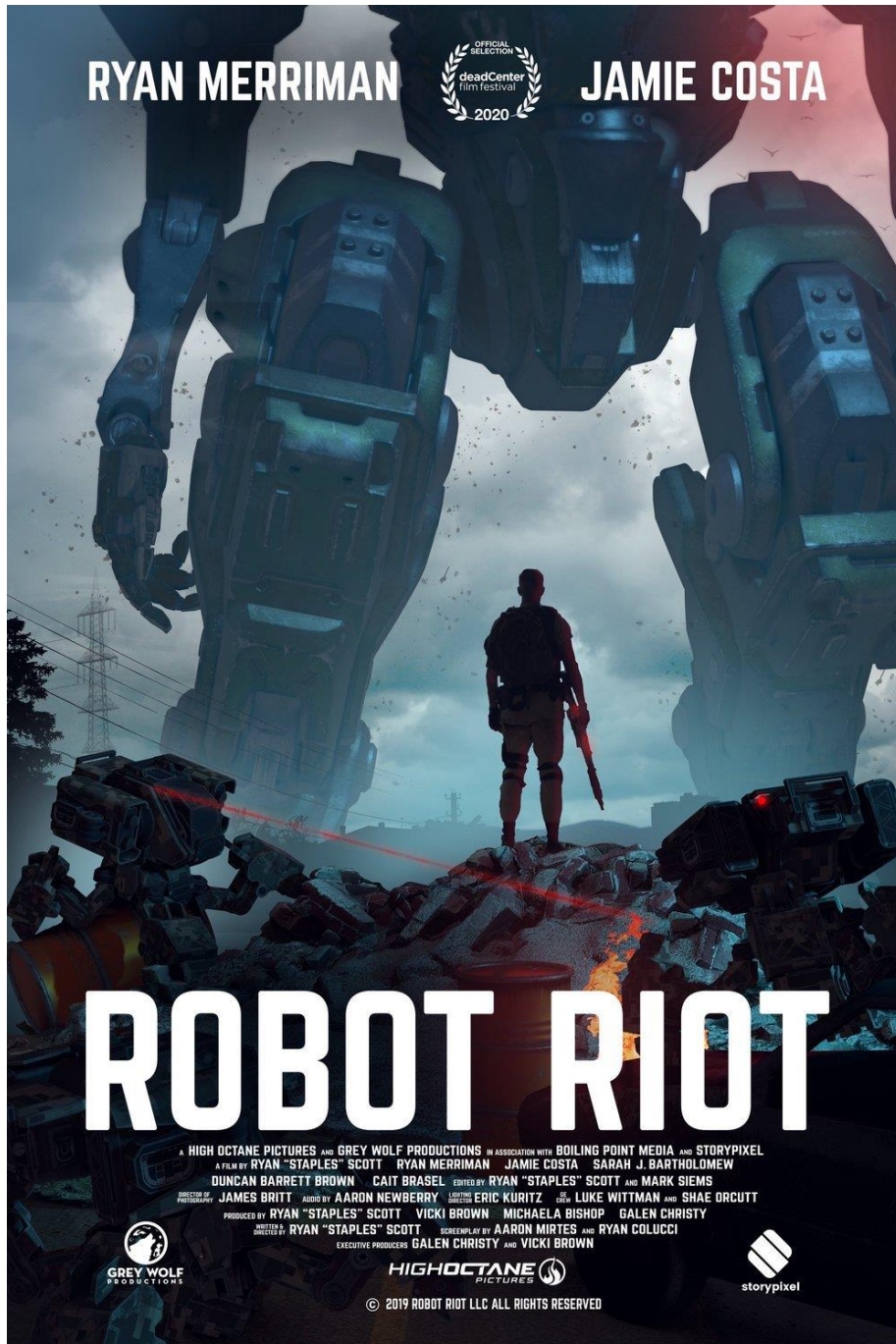
Film poster of Robot Riot , directed by Ryan Staples Scott US release date: August 13, 2020