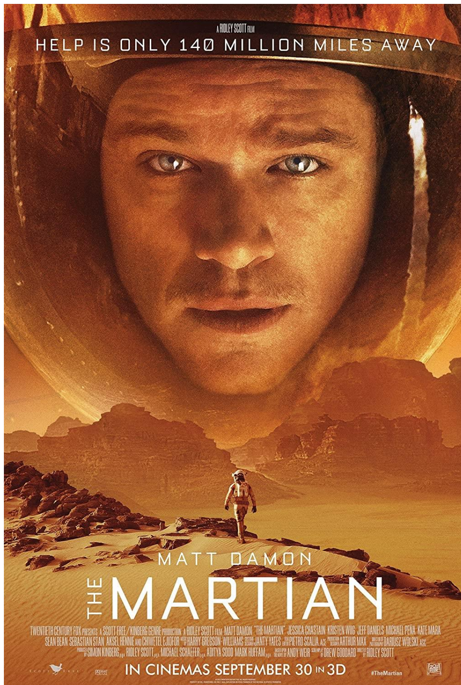
Film poster for The Martian , dir. Ridley Scott, 2015