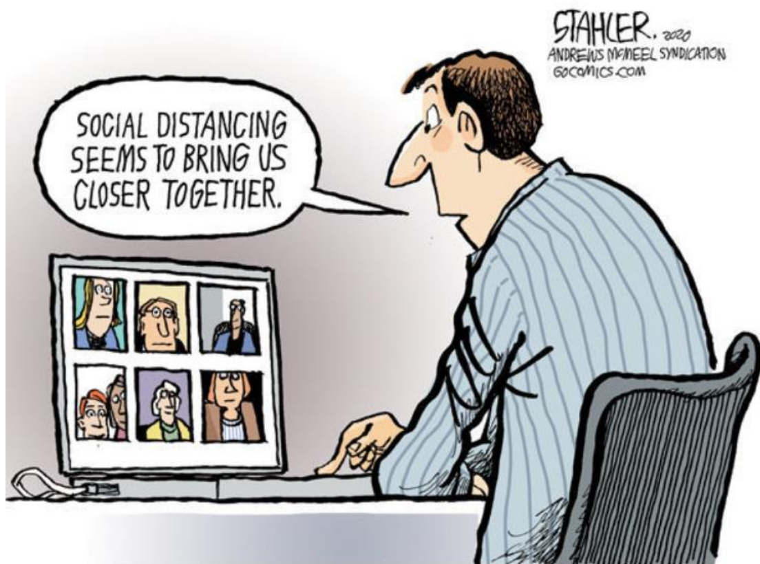
Jeff Stahler, June 2020 https://www.gocomics.com/jeffstahler