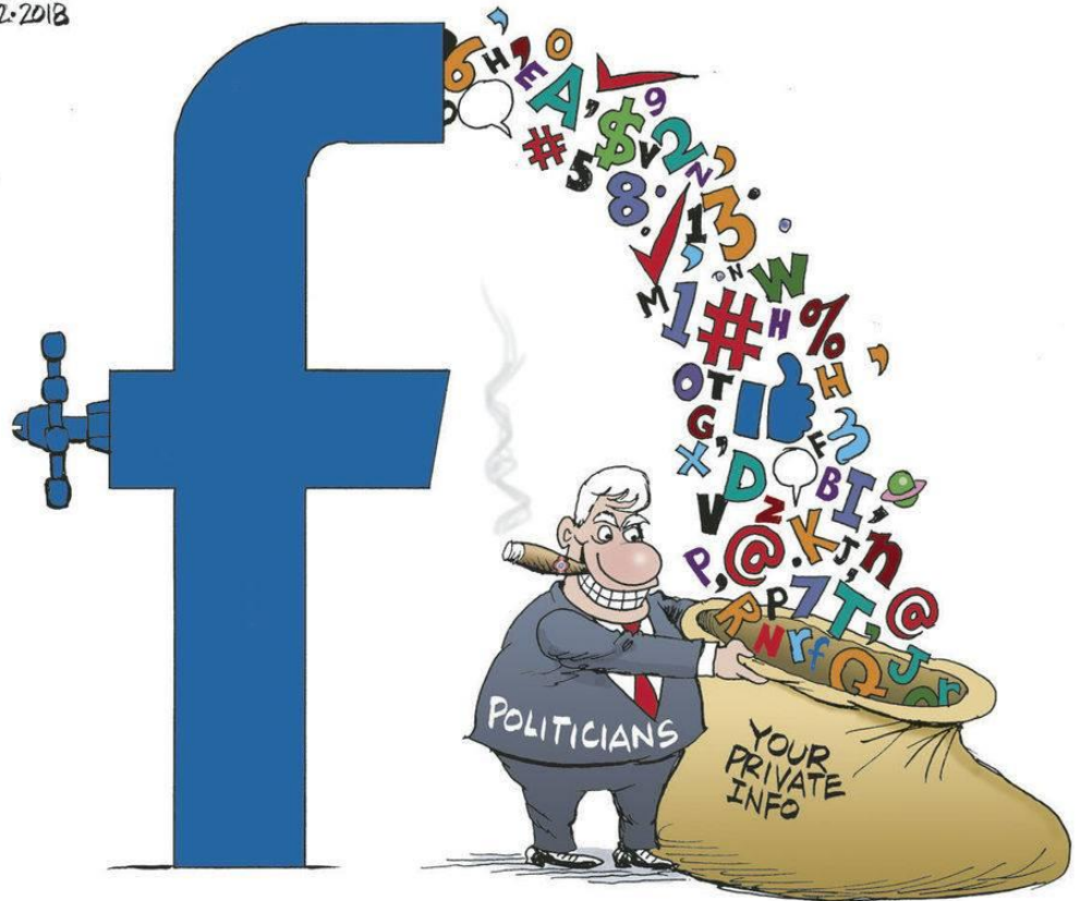
Cartoon by Bruce Plante, March 22, 2018

https://tulsaworld.com/opinion/columnists/bruce-plante-cartoon-facebook/article_3ac64dbb-f8f8-5b09-a8a3-b50135796212.html