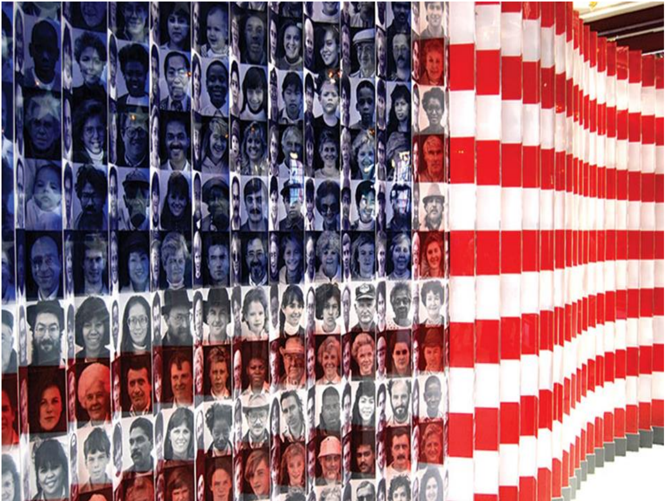
“American Flag of Faces” An American flag featuring the faces of immigrants on display at Ellis Island.

https://clas.berkeley.edu/research/immigration-economic-benefits-immigration http://clas.berkeley.edu/