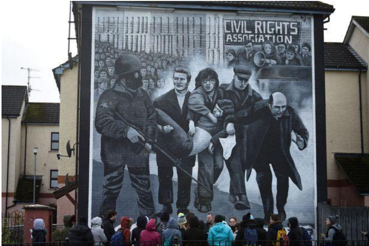
Tourists stand in front of a mural depicting the 1972 Bloody Sunday events, in Londonderry, Northern Ireland, March 14, 2019.