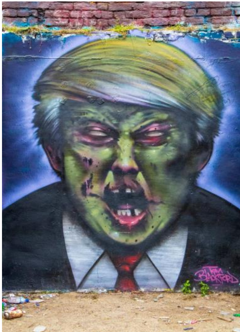
Brick Lane, London, UK, 2020