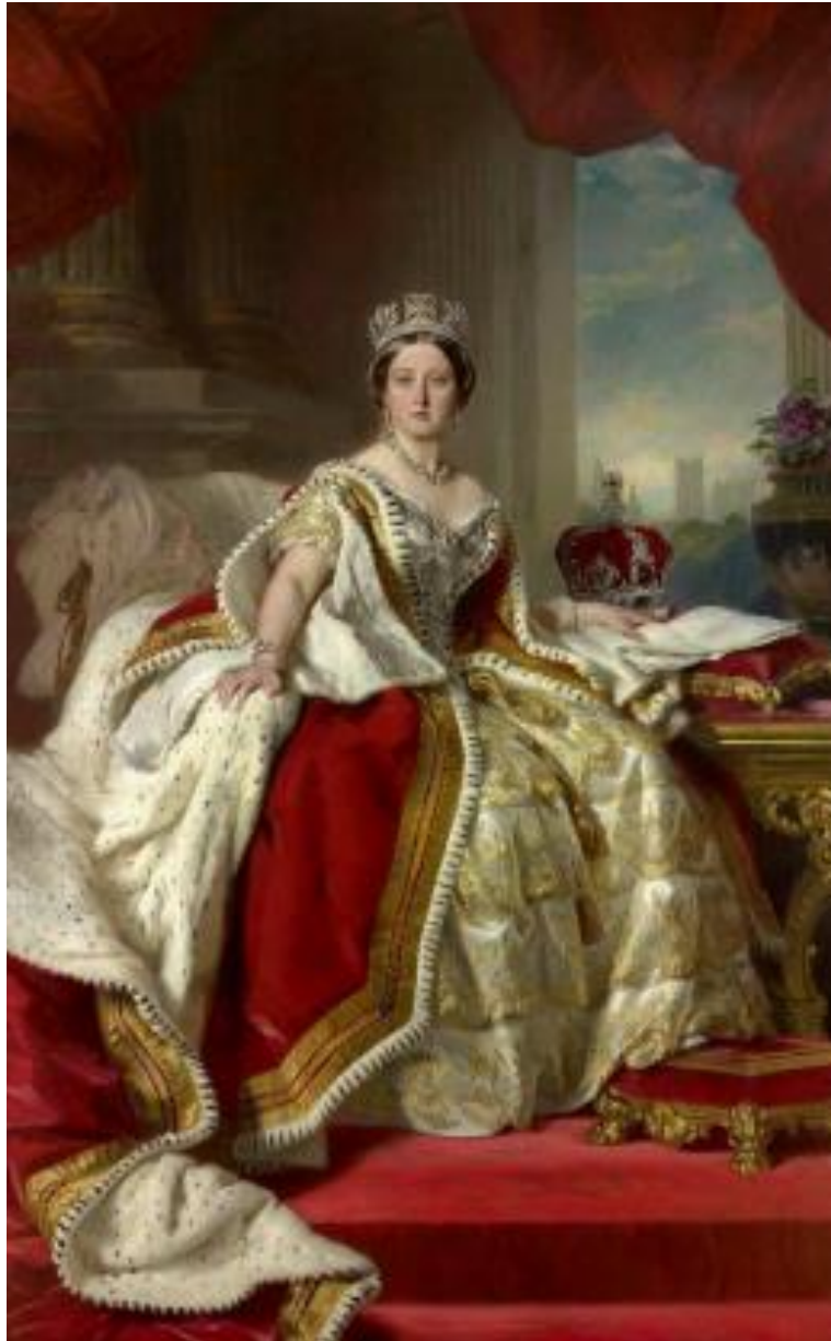
Queen Victoria (1819-1901) by Franz Xaver Winterhalter (1805-1873) Signed and dated 1859, commissioned by Queen Victoria Oil on canvas | 241.9 x 157.5 cm The Royal Collection Trust, State Dining Room, Buckingham Palace