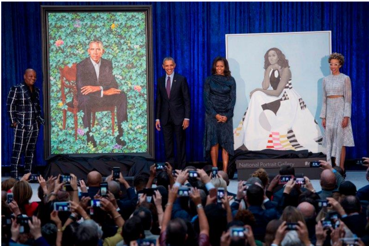
Barack Obama and Michelle Obama with their respective artists at the Smithsonian's National Portrait Gallery in Washington DC, on Feb. 12, 2018