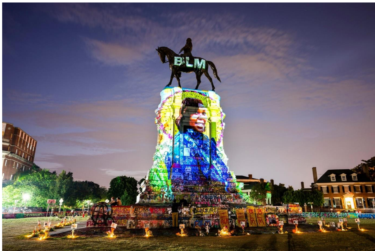
A “Black Lives Matter” photograph of Breonna Taylor projected onto the statue of Confederate General Robert E. Lee on Monument Avenue in Richmond, Virginia, in July 2020

From https://www.nytimes.com