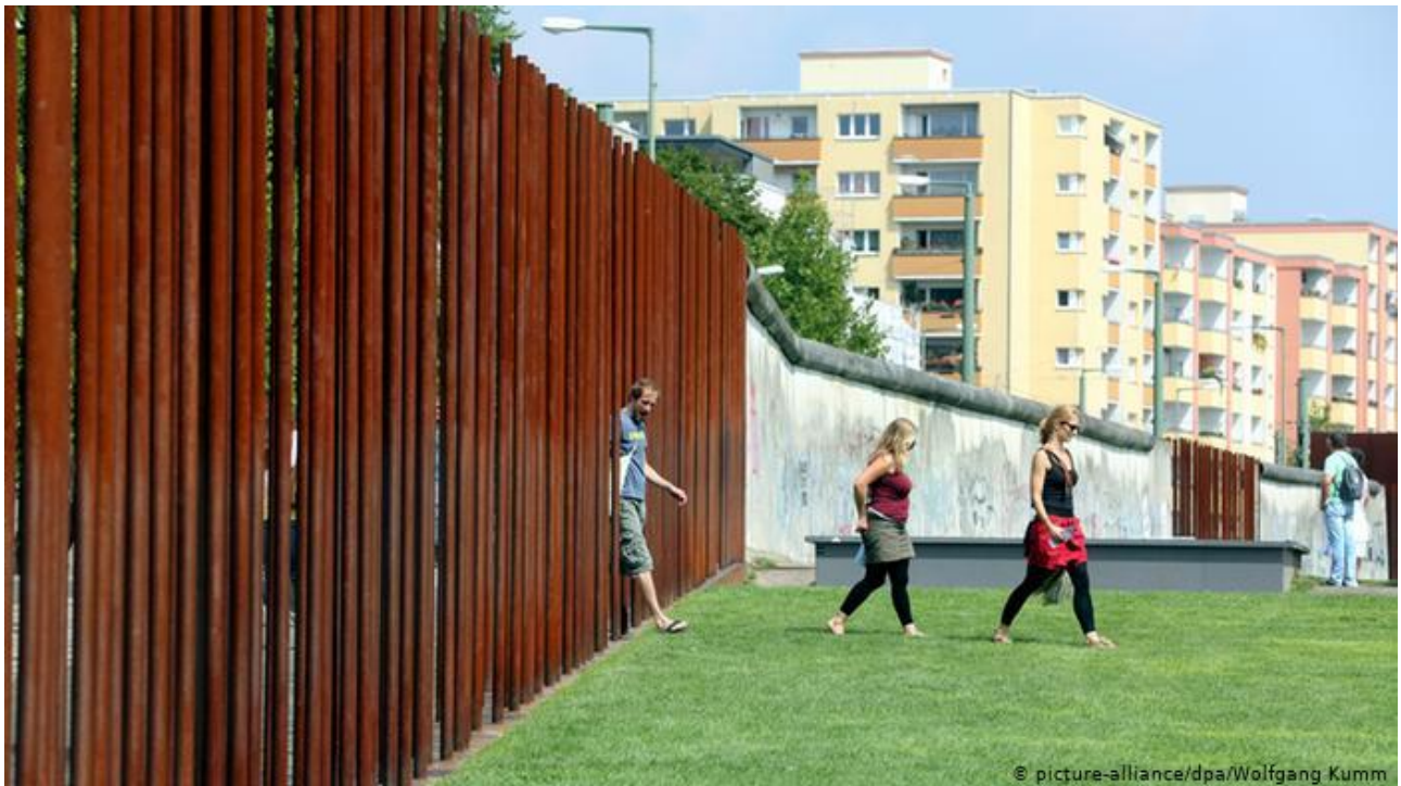
30 Jahre Mauerfall - Spiegel der Geschichte: Gedenkstätte Berliner Mauer