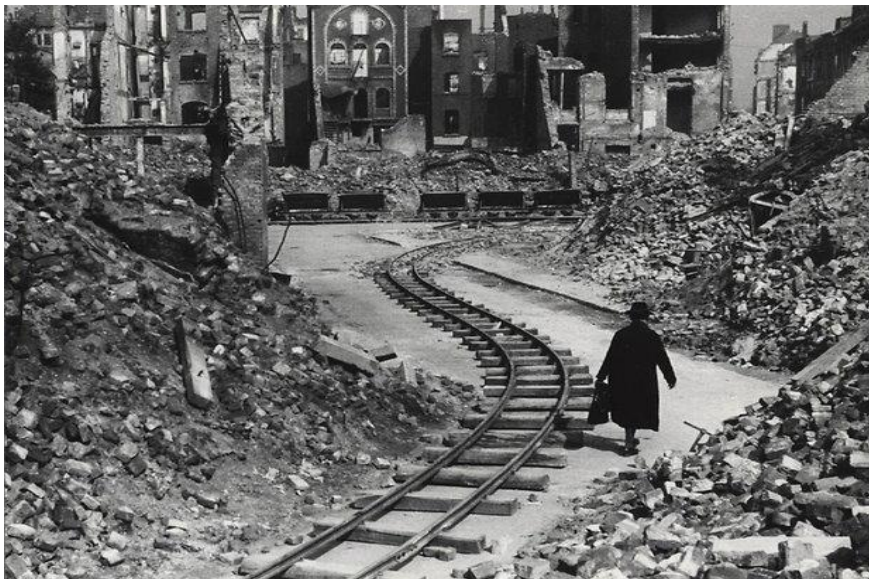
„Die Stunde Null“, Ritterstraße in Köln um 1947

Erklären Sie, warum es wichtig ist, dass wir uns heute noch an die Vergangenheit erinnern. Sie können sich dabei auf das Foto stützen.