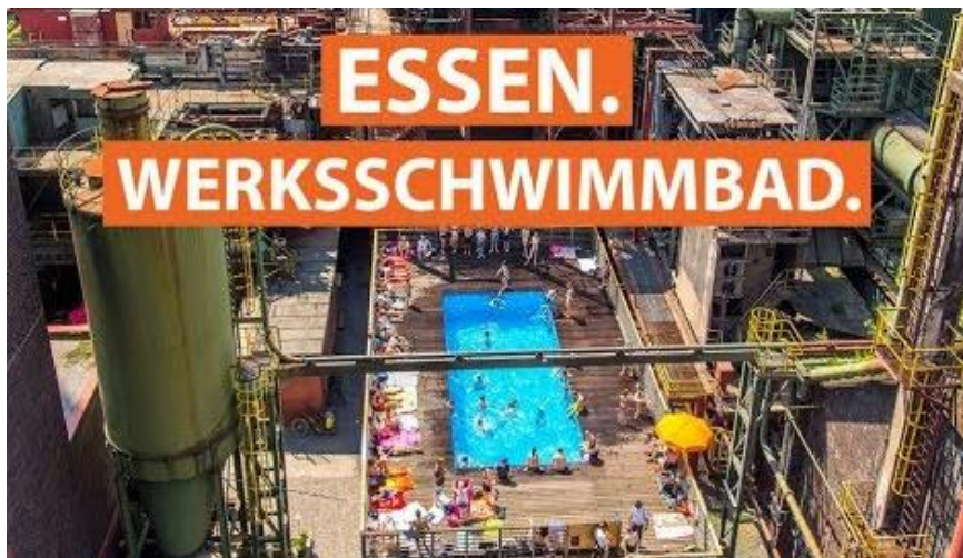
Das Werksschwimmbad in Essen: Baden im Industriedenkmal.

Sind historische Bauwerke nur Kulisse für Touristen-Selfies oder lebendige Orte für die Bevölkerung? Sollen sie originalgetreu erhalten werden oder sollen sie andere Funktionen bekommen? Erklären Sie Ihren Standpunkt und geben Sie konkrete Beispiele.